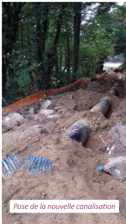
Pose de la nouvelle canalisation

1600 mètres d'adduction de diamètre 500 mm appelés « tronçon Bigotière », datant de 1880 et situés au cœur de la vallée du Couesnon, sur la commune nouvelle de Maen Roch, ont été renouvelés à l'automne 2018.