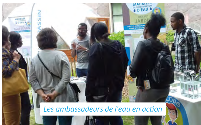
Les ambassadeurs de l'eau en action

Le programme d'économie d'eau 2016-2018 donnera lieu cette année à un bilan et une réflexion avec les élus et les partenaires pour élaborer la suite dès 2020.